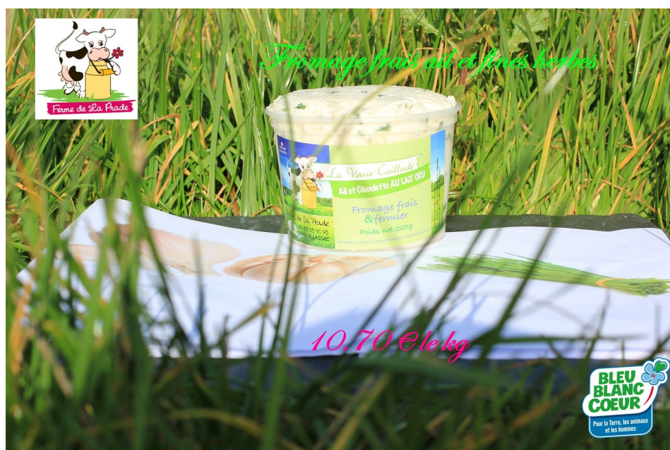
Fromage frais ail et fines herbes

Avec la saison des radis qui arrive, n'hésitez pas à venir acheter du fromage ail et fines herbes. À consommer également sans modération sur une salade verte ou sur une viande grillée au barbecue. Un vrai régal pour le plaisir des papilles !!!